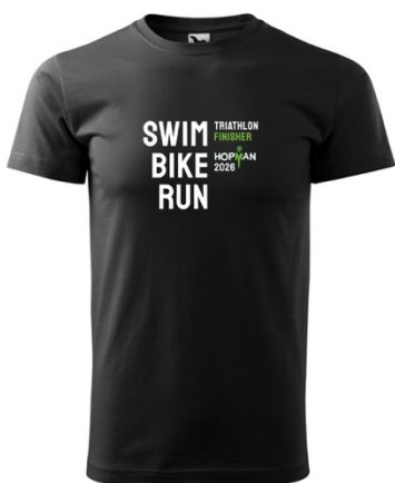
(250Kč) Účastnické tričko - muži