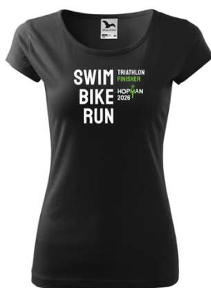
(250Kč) Účastnické tričko - ženy