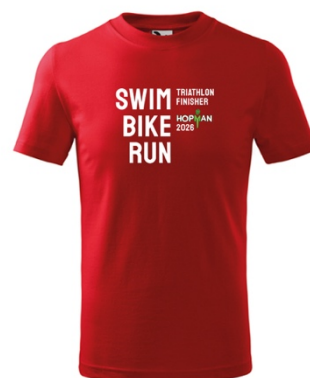
(200Kč) Účastnické tričko - děti